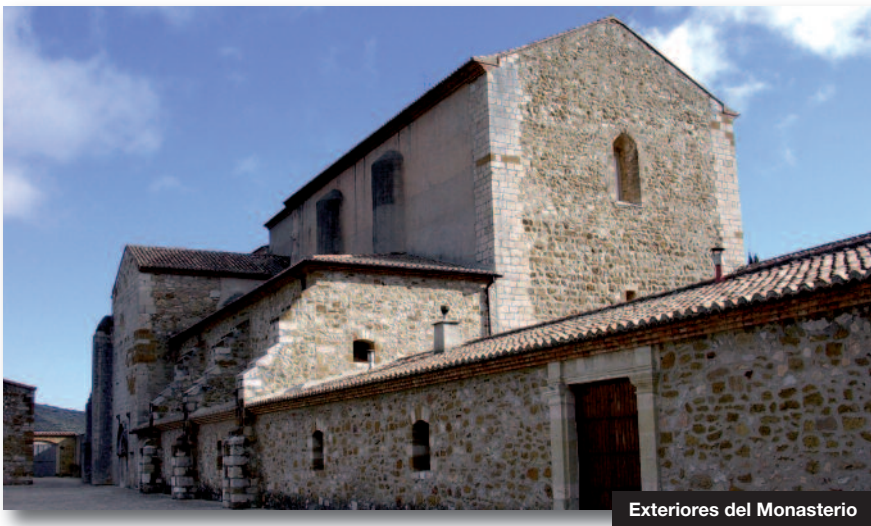
Exteriores del Monasterio