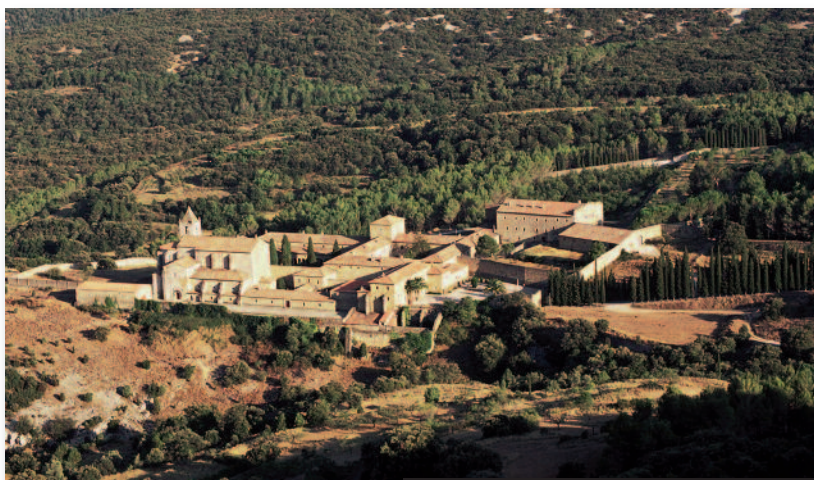
Monasterio de Santa Maria de Benifassà

Es uno de los conjuntos monumentales más antiguos de la Comunidad Valenciana y la principal y más emblemática joya artística de toda la zona. Se trata de un extraordinario ejemplo de arquitectura gótica, perteneciente a la Escuela Cisterciense, construido en el siglo XIII, con posteriores reformas. Está catalogado como monumento histórico-artístico nacional, desde 1931.