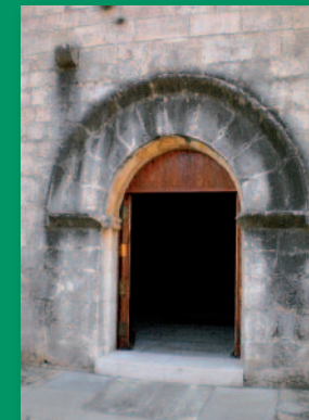
Portalada románica de la iglesia del monasterio

“Las campanas del monasterio retumban por los montes, caminos y senderos de la Tinença de Benifassà, convirtiendo el lugar en un refugio sagrado de silencio y sensibilidad”.