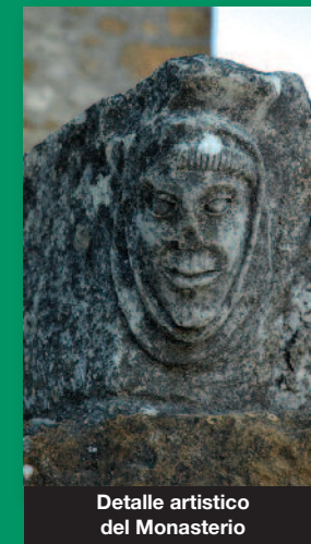
Detalle artístico del Monasterio