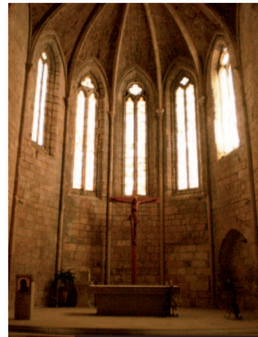
Interior de la iglesia del monasterio

Residencia privada: La parte de la cartuja, privada a visitantes, está formada por un bello claustro con arcos apuntados, del s.XIV. En un lateral se halla la sala capitular, a la que se accede a través de un arco trilobulado, el rectorio (gran sala cuadrangular), la sacristía vieja y las cocinas.